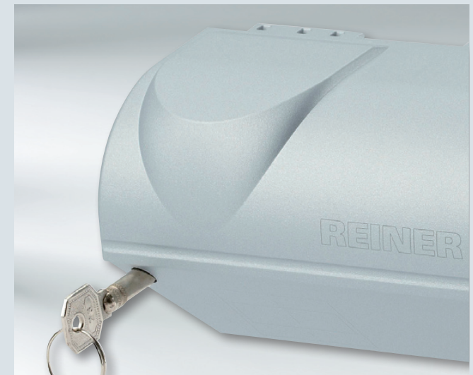
Gehäuseschloss, schützt vor Manipulationen an der Textplatte.