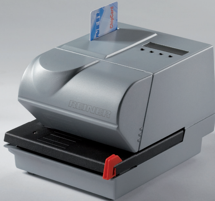
Abdruckbeispiele in Originalgröße